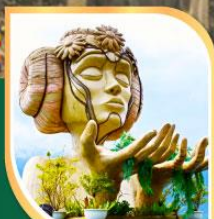
โมนาน่า ซาปา คาเฟ